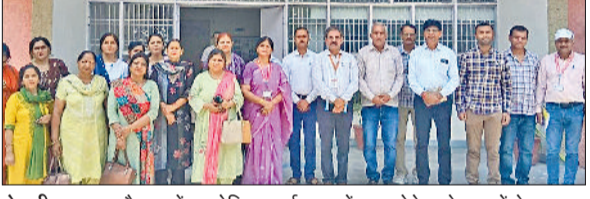
रेवाड़ी। डाइट हरीनगर में आयोजित कार्यशाला में भाग लेने वाले स्कूलों के प्रतिनिधि।

देखने को मिला था। भांडोरिया ने टिकट नहीं मिलने के बाद निर्दलीय प्रत्याशी के रूप में ताल ठोक दी थी। बाद में कैप्टन उन्हें मनाने में कामयाब हो गए। धारूहेड़ा में भी कैप्टन की मर्जी से राज को टिकट दी गई, जिस कारण उनकी प्रतिष्ठा का आकलन भी यह चुनाव तय करेगा।