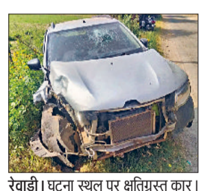
रेवाड़ी। घटना स्थल पर क्षतिग्रस्त कार।