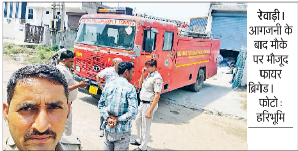
रेवाड़ी। आगजनी के बाद मौके पर मौजूद फायर ब्रिगेड।

किए। साथ ही फायर ब्रिगेड और पुलिस को भी सूचना दी गई। कसोला पुलिस और फायर ब्रिगेड मौके पर पहुंच गए। फायर ब्रिगेड ने जल्द आग पर काबू पा लिया। इससे पूर्व फैक्ट्री के वर्कर्स को सुरक्षित बाहर निकाला गया। पॉलीथिन की फैक्ट्री में आग की सूचना से आसपास की कंपनियों में भी हड़कंप मच रहा। अगर आग विकराल रूप धारण करती, तो इससे आसपास की कंपनियों भी लपेटे में आ सकती थीं। आग पर काबू पाए जाने के बाद प्रबंधन ने राहत की सांस ली। बताया जा रहा है कि अगर आग पर जल्द काबू नहीं पाया जाता, तो पॉलीथिन में लगी आग विकराल रूप धारण कर सकती थी। पुलिस ने आगजनी के कारणों का पता लगाने के प्रयास शुरू कर दिए।