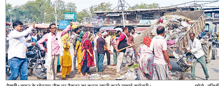
रेवाड़ी। बावल के छोट्टाराम चौक पर ट्रैक्टर का कचरा खाली करते सफाई कर्मचारियों।

बावल नगरपालिका में नगरपालिका कर्मचारी संघ के आह्वान पर सफाई कर्मियों की हड़ताल मंगलवार बारहवें दिन भी जारी रही। कर्मचारियों की हड़ताल के कारण कस्बे में जगह-जगह गंदगी के ढेर लगे हुए हैं, जिससे सफाई व्यवस्था बिगड़ने से लोगों को परेशानी उठानी पड़ रही है। मंगलवार को डोर टू डोर कचरा कलेक्शन का ठेका लेने वाले ठेकेदार की ओर से बाजार से कचरे का उठान करने पर हड़ताली कर्मचारियों का गुस्सा फूट पड़ा और सफाई कर्मचारियों ने कस्बे के छोट्टाराम चौक पर ट्रैक्टर का कचरा वापस खाली करके विरोध जताया। इस मौके पर कर्मचारियों ने सरकार के खिलाफ नारेबाजी भी की। कर्मचारियों ने कहा कि जब तक उनकी मांगें पूरी नहीं होती तब तक न तो वे स्वयं सफाई करेंगे और नहीं किसी को कचरे का उठान करने देंगे। कर्मचारियों ने कहा कि हड़ताल को कमजोर करने वाले लोगों को