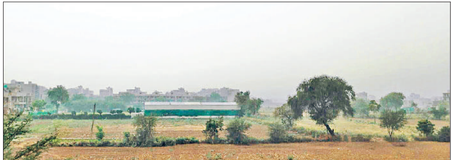
रेवाड़ी। मंगलवार शाम को छाए बादल।

एक ही दिन में दिन का पारा 6.0 डिग्री तक बढ़ने से आसमान से आग बरसना शुरू हो गया है। भारी गर्मी ने जनजीवन पर एक बार फिर से असर डालना शुरू कर दिया है। मौसम में बार-बार बदलाव आ रहा है। शाम के समय अचानक बादल छाने के बाद कई इलाकों में बूदाबांदी से लेकर हल्की बरसात तक हुई। दो दिन तक मौसम इसी तरह का बना रह सकता है। बीते सोमवार को सुबह के समय हुई हल्की बरसात के बाद तापमान कम होकर 35.0 डिग्री सेल्सियस पर आ गया था। इससे