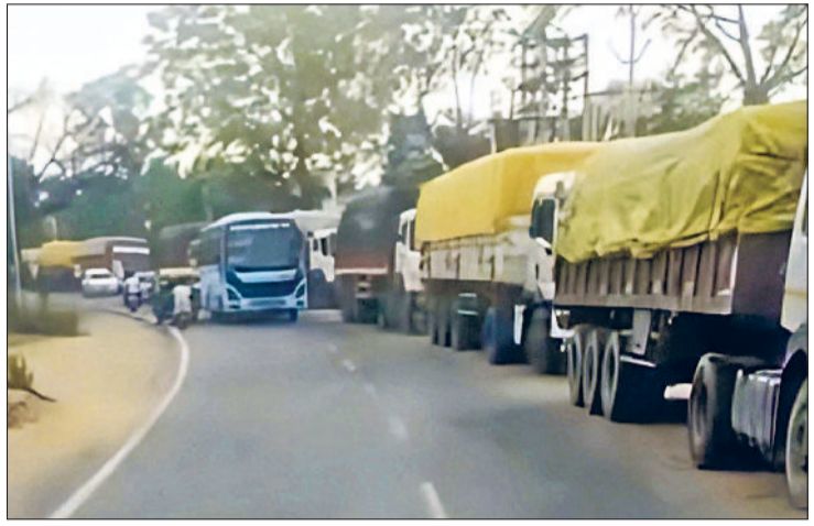
रेवाड़ी। नंदरामपुर बास रोड पर सड़क किनारे खड़े भारी वाहन। इससे लोगों को आने-जाने में भारी परेशानी का करना पड़ता है सामना।