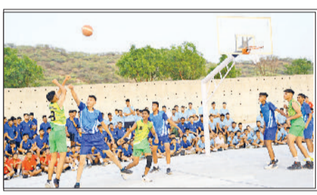
रेवाड़ी। बास्केटबॉल प्रतियोगिता में खेलते हुए खिलाड़ी तथा विजेता टीम को ट्रॉफी प्रदान करते हुए स्टाफ।