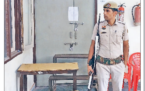
रेवाड़ी। सेक्टर-18 गर्ल्स कॉलेज में स्ट्रॉग रूम के बाहर तैनात जवान।