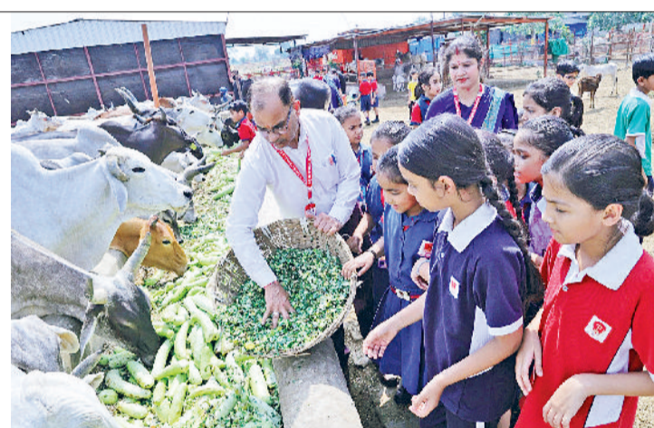
रेवाड़ी। गोशाला में गायों को चारा खिलाते बच्चे।