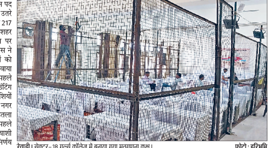
रेवाड़ी। सेक्टर-18 गर्ल्स कॉलेज में बनाया गया मतगणना कक्ष।